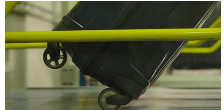
Banco de pruebas de equipaje